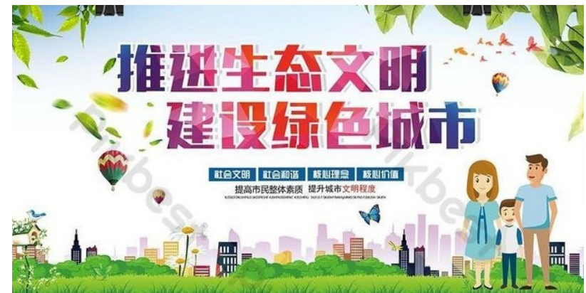
Affiche de propagande pour la « Civilisation Écologique » du Parti Communiste Chinois